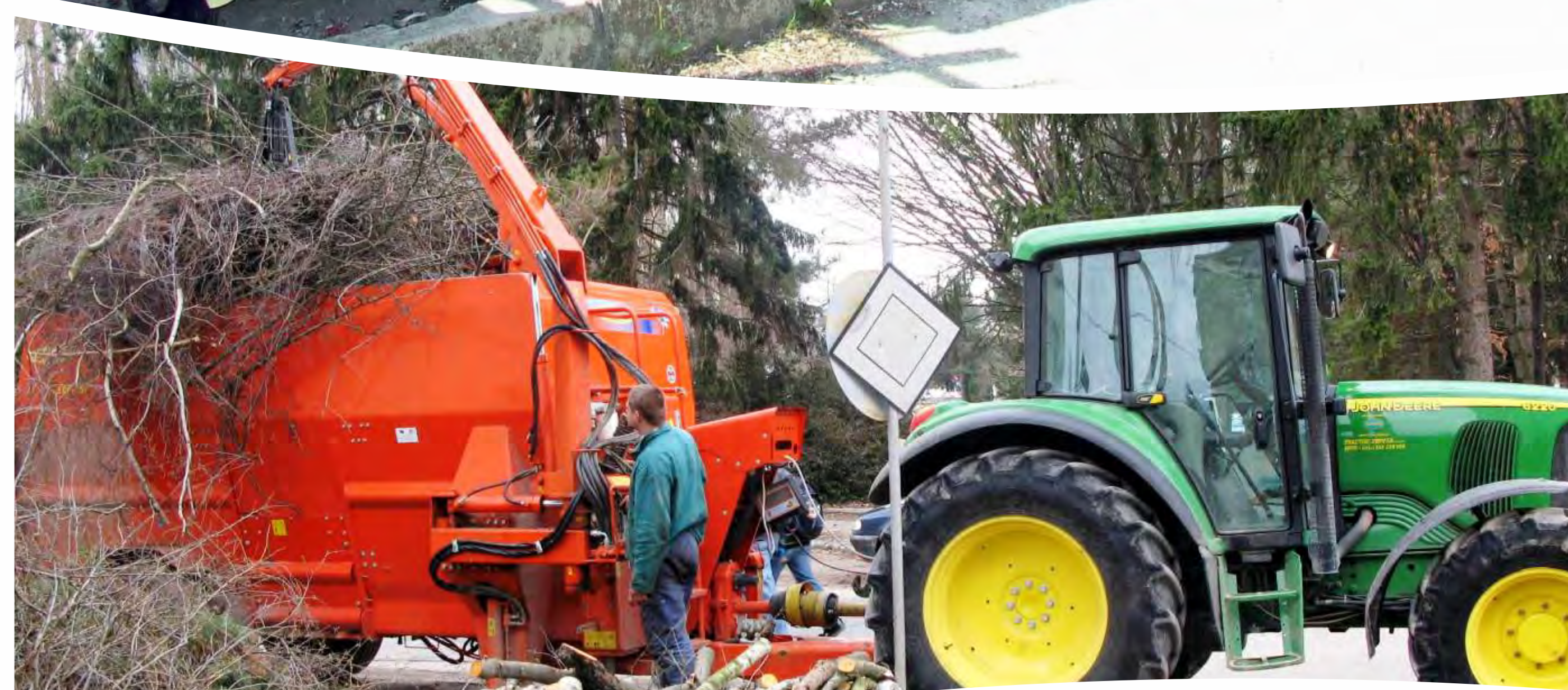
3. Zber a drvenie konárov v mobilnom miešacom a rezacom voze SEKO.