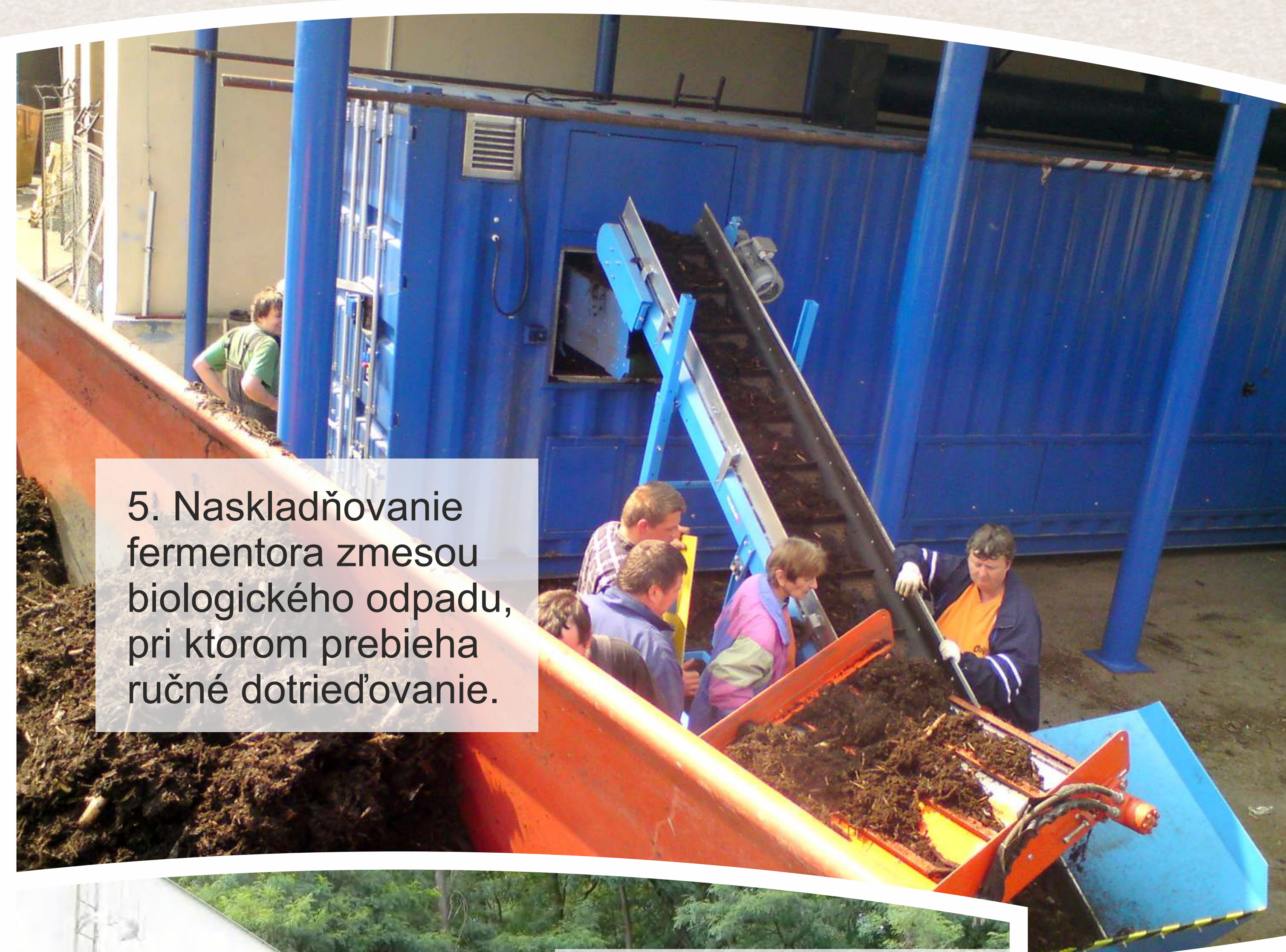
5. Naskladňovanie fermentora zmesou biologického odpadu, pri ktorom prebieha ručné dotriedňovanie.

Využitie kompostu: výhradne pre potreby mesta na údržbu zelene.