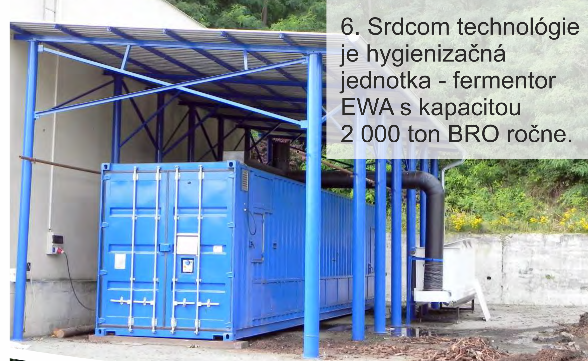
6. Srdcom technológie je hygienizačná jednotka - fermentor EWA s kapacitou 2 000 ton BRO ročne.