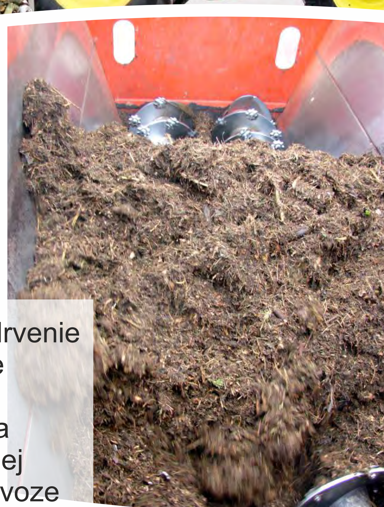
4. Konečné drvenie a namiešanie biologického odpadu podľa vopred určenej receptúry vo voze SEKO.