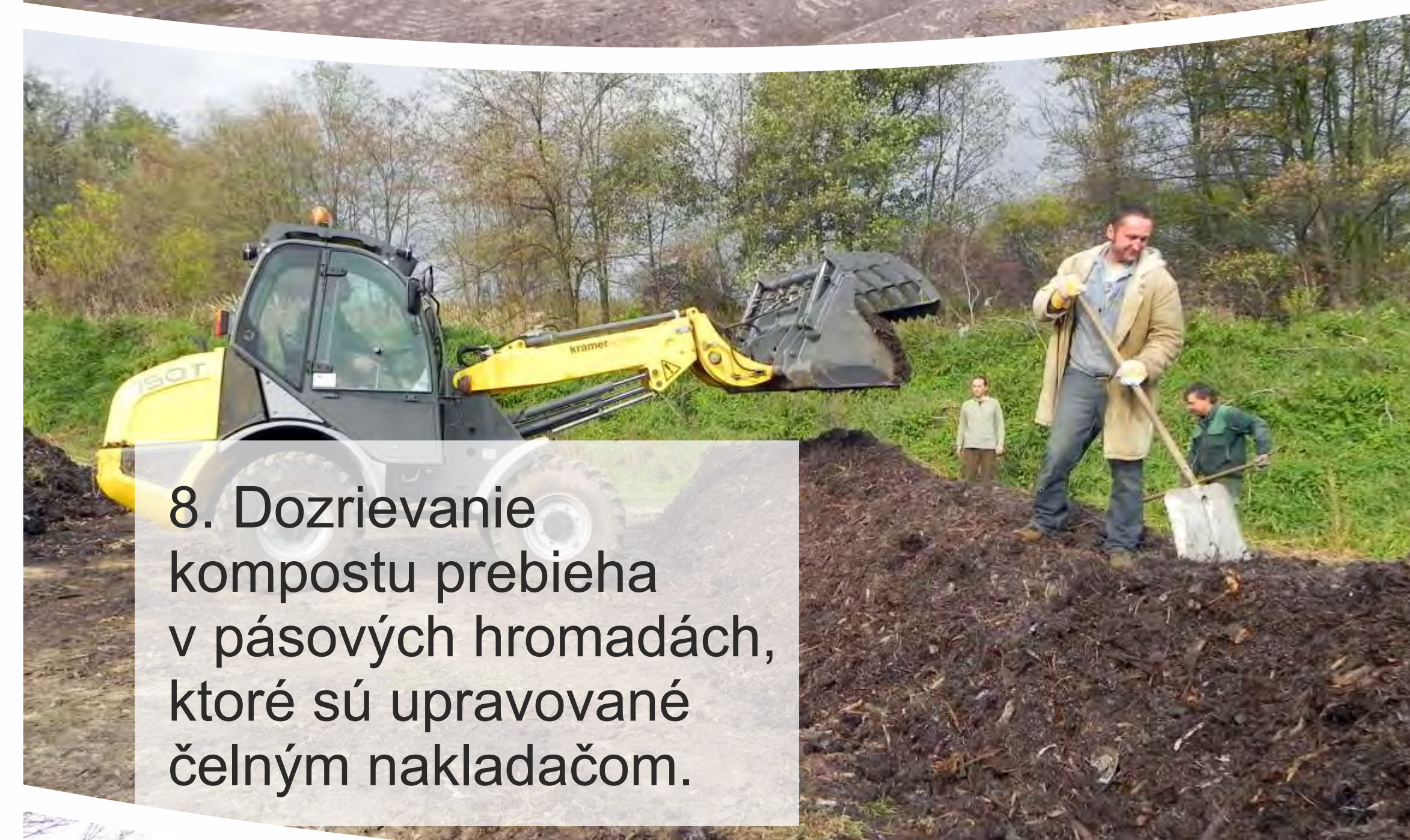
8. Dozrievanie kompostu prebieha v pásových hromadách, ktoré sú upravované čelným nakladačom.