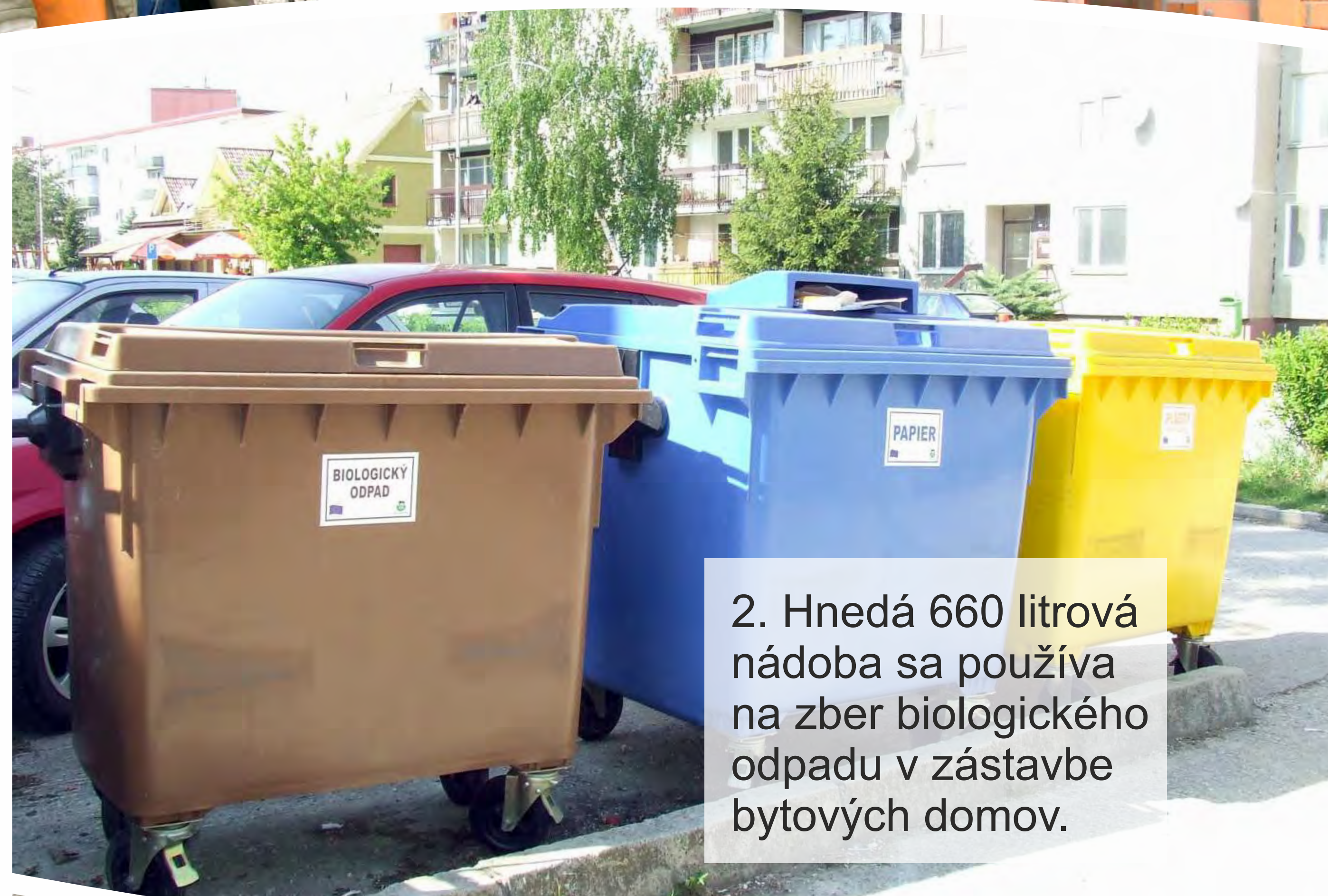
2. Hnedá 660 litrová nádoba sa používa na zber biologického odpadu v zástavbe bytových domov.