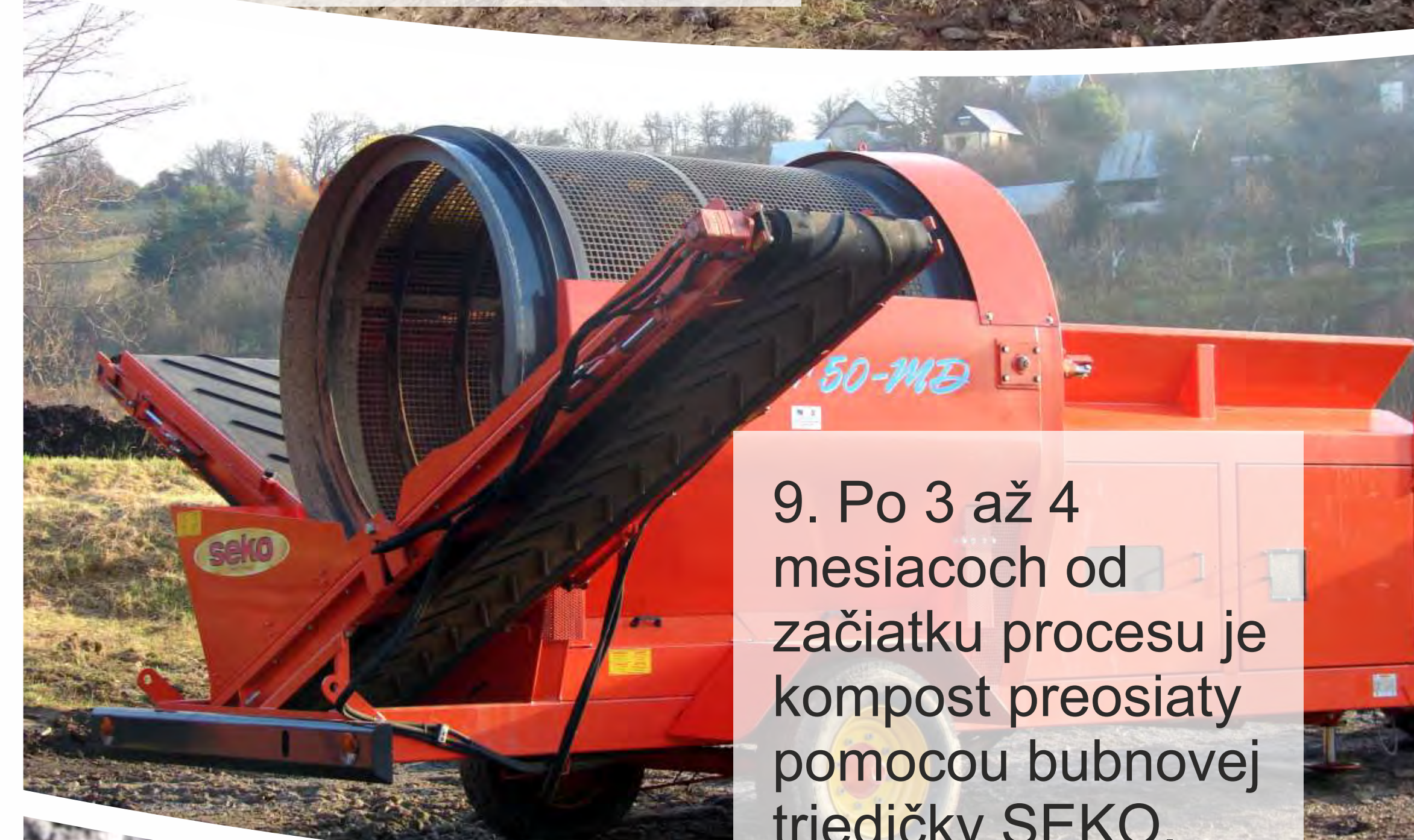
9. Po 3 až 4 mesiacoch od začiatku procesu je kompost preosiaty pomocou bubnovej triedičky SEKO.