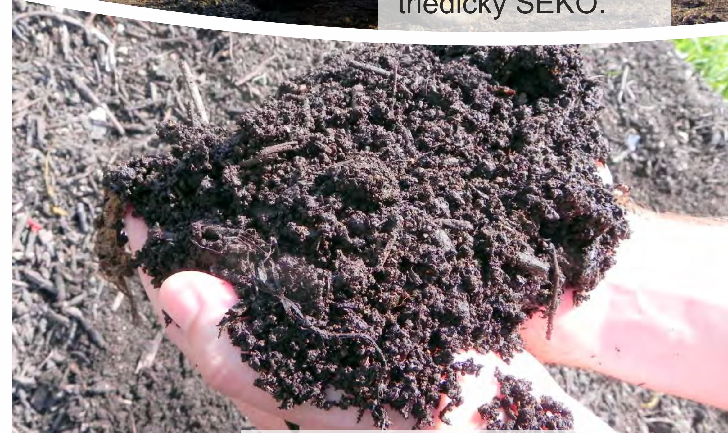
10. Preosiaty kompost je zmiešaný so zeminou a používaný pri výsadbe a údržbe verejnej zelene v meste.