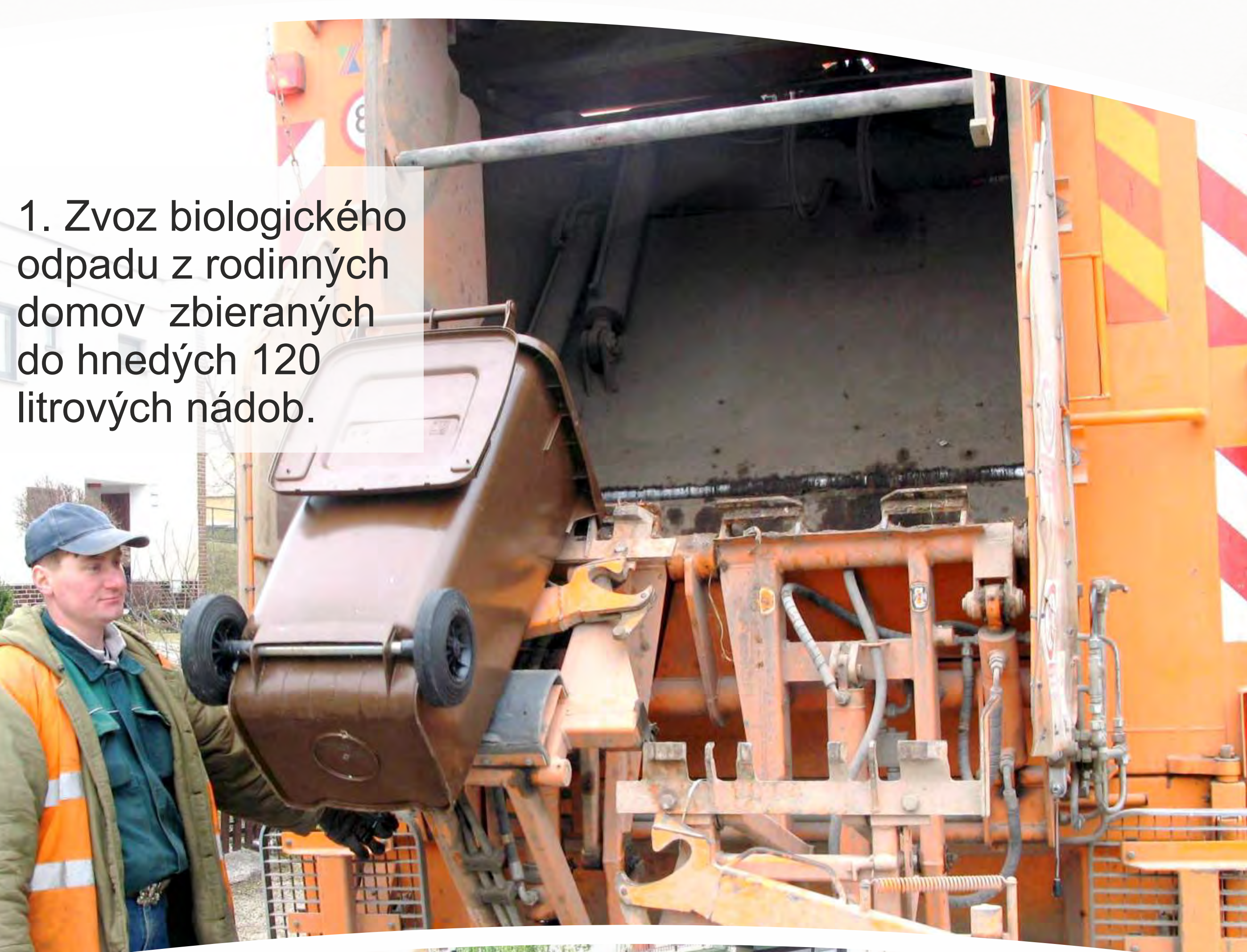
1. Zvoz biologického odpadu z rodinných domov zbieraných do hnedých 120 litrových nádob.